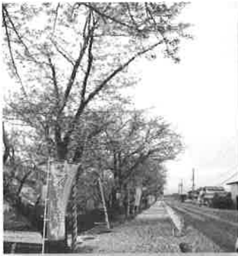
花巻市内の桜です。だいぶ花びらが散っていました。