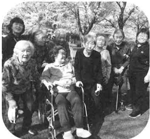
【お花見 in 胆沢運動競技場】