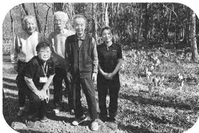
【水芭蕉見物 in 若柳 見物に来ていた方が撮影してくれました】