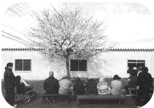
【お花見 in 見分けの森敷地内】

今年も、昨年と同様に4月に入ると気温が上昇。 一斉にたくさんの花々が開花したので、敷地内でのお花見、 には物足りず早速ドライブへ出かけ、水芭蕉や菜の花、桜、 モクレン、こぶし、すいせん等々青空の下、車から下車し、 春を満喫して来ました~!!!