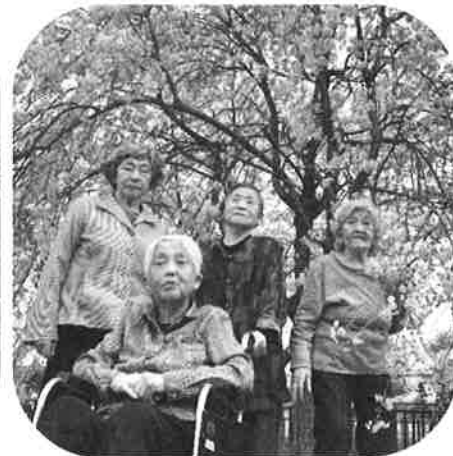
【お花見 in 水沢地区センター敷地内】