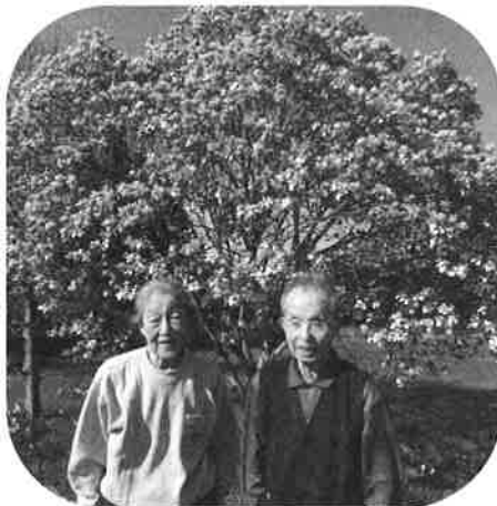
【モクレン in 南都田某所】